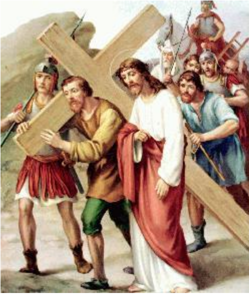
(Padre Nuestro, Ave María y Gloria)

"Adorámote Cristo y bendecíste, que por tu santa cruz redimiste al mundo."