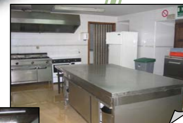
Cocina y Despensa