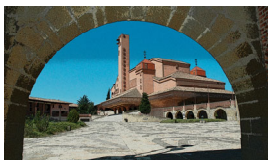
Santuario de Torreciudad (Huesca)

El Patronato de Torreciudad es una asociación civil que tiene entre sus objetivos la organización de jornadas, encuentros y actividades que promuevan el voluntariado social, la defensa del medio ambiente y la recuperación del patrimonio cultural.